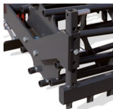
REGOLAZIONE LIVELLA RULLO LEVEL ADJUSTMENT ROLLER