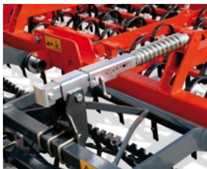
REGOLAZIONE DOPPIO RULLO POSTERIORE ADJUSTMENT OF DOUBLE REAR ROLLER DEPTH