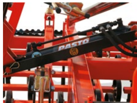
BARRA DI SICUREZZA PER IL TRASPORTO BARS FOR THE TRANSPORT SAFETY