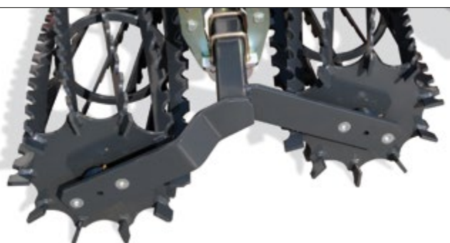
DOPPIO RULLO DENTATO DOUBLE TOOTHED ROLLER