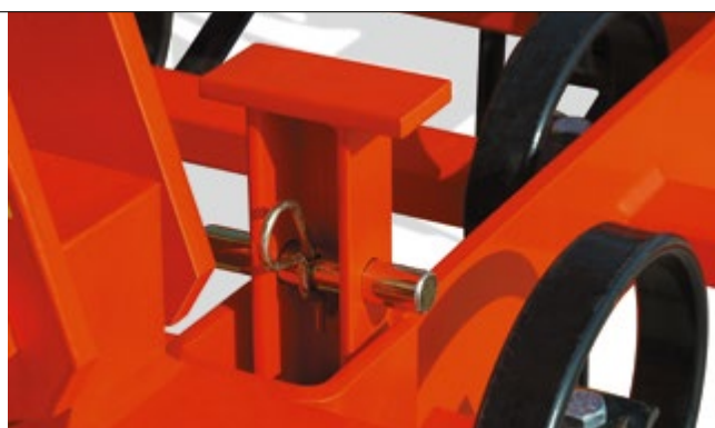
BLOCCAGGIO ELEMENTO DENTI TEETH SYSTEM LOCKING DEVICE