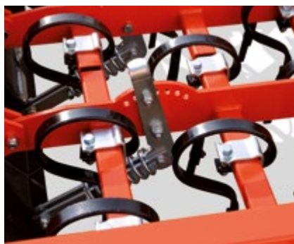
REGOLAZIONE LIVELLA ANTERIORE FRONT LEVEL ADJUSTMENT